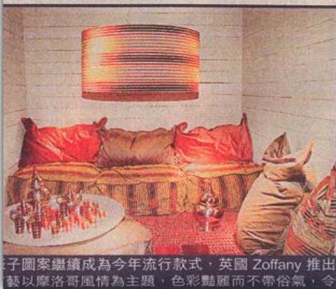
■ 圖案繼續成為今年流行款式，英國 Zoffany 推出藝以摩洛哥風情為主題，色彩豔麗而不帶俗氣，令