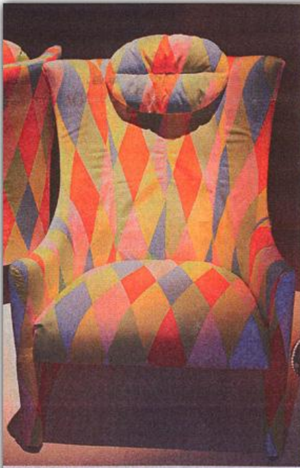
■ 充滿北歐設計風格的椅子，其實是著名意大利設計師 Vico Magistretti 的 2004 年新作，配合意大利的優質布藝椅子製作技巧，更顯矜貴。上圖的搖椅名為 Basket，約售 2500 港元，左圖的 Girotondo 梳化售價約為 4700 港元。