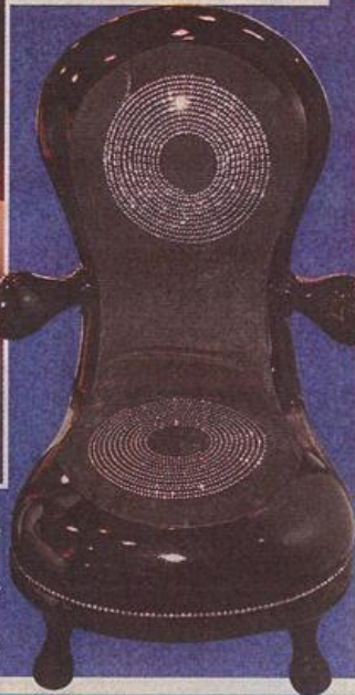
■ 「Disco」真皮椅子為人手製造，只限量製造，備有白色及紅色選擇，售價約為 2.3 萬港元。 (Lyle & Lisa)